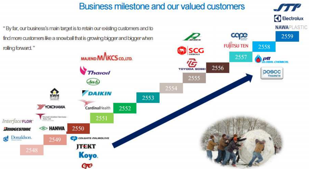
Figure 2 : New contracts arrive